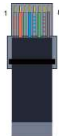
EIA TIA 568B

Убедитесь, что оба конца кабеля соответствуют одному и тому же стандарту EIA/TIA 568A или 568B.