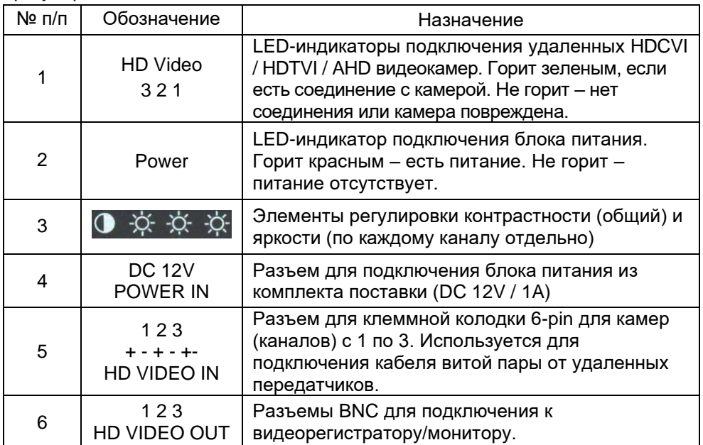
Таб. 1 Активный приемник RA-H3/2, разъемы, индикаторы и элементы регулировки