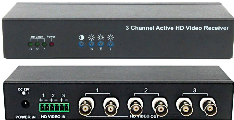
Рис.1 Активный приемник RA-H3/2, внешний вид спереди/сзади