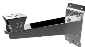
DS-1774ZJ-Y Крепление на стену