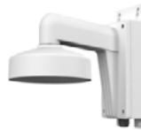
DS-1272ZJ-110B Настенный кронштейн