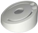
DS-1259ZJ Потолочное крепление