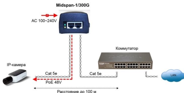
Рис. 3. Схема подключения инжектора Midspan-1/300G

Инжекторы Midspan-1/190A, Midspan-1/300A подключаются аналогично.