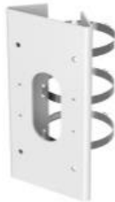
DS-1276ZJ-SUS Крепление на столб