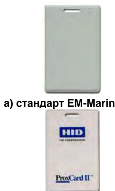
а) стандарт EM-Marlin