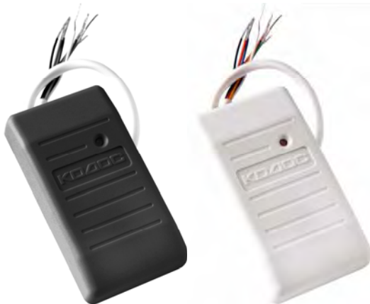
Рисунок 1 – внешний вид считывателя

Считыватель предназначен для приема, обработки и передачи кода бесконтактных электронных кодоносителей стандартов EM-Marlin и HID в линию связи с управляющими устройствами серии «КОДОС» (например, контроллерами «КОДОС ЕС-202», «КОДОС RC-102», ППКОП «КОДОС А-20», и др.) и управляющими устройствами, работающими по протоколу «WIEGAND-26».