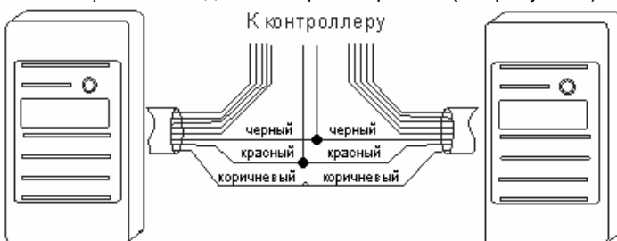
Рисунок 3 – Подключение синхронизированных считывателей

При размещении считывателей в непосредственной близости друг от друга (менее 1 м) их необходимо синхронизировать (см. рисунок 3).