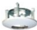
DS-1227ZJ Потолочный кронштейн