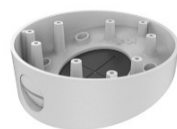
DS-1281ZJ-DM23 Скошенный потолочный кронштейн