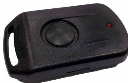
Метка в корпусе.

В отличие от стандартной метки (ActiveTag), данная метка не передает свой код постоянно. Отправка кода метки производится только при нажатии кнопки на корпусе. Метка также снабжена светодиодом, который кратковременно включается только при нажатии кнопки.