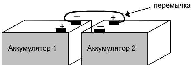
Рисунок. 2 Схема соединения аккумуляторов перемычкой