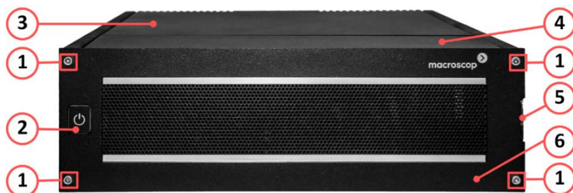
Рисунок 1. Вид спереди