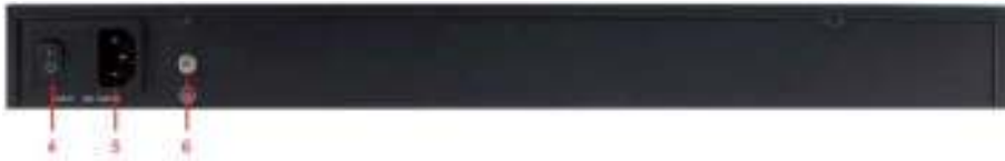
Рис. 6 Задняя панель инжекторов