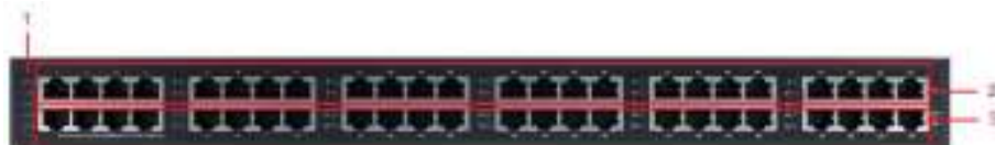
Рис. 5 Передняя панель Midspan-24/370RG