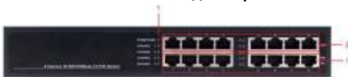
Рис. 2 Передняя панель Midspan-8/150RG