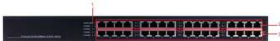
Рис. 4 Передняя панель Midspan-16/250RG