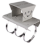
DS-1214ZJ Крепление на столб